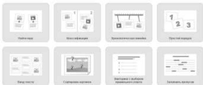
Рис. 1. Так выглядит выбор типа создаваемого задания

LearningApps — это 20 интерактивных упражнений (в LearningApps они названы приложениями, поэтому далее в тексте эти термины будут использоваться как синонимы) в игровом формате. Отсюда чувствуется, что, в первую очередь, сервис создавался для преподавателей, работающих с детьми. Например, задания вроде «Скачки» или «Найди пару» явно заимствованы из детских игр.