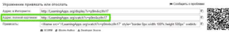
Рис. 7 Нужно использовать код под заголовком "Адрес полной картинки"