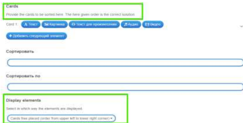
Рис. 9 Не весь интерфейс переведен на русский язык